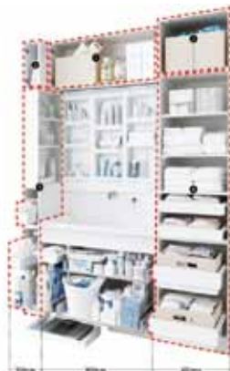
TOTO「オクターブ」のオプションキャビネットをレイアウトした例

オプションでスペースにあわせて、天井近くの上部用、狭い隙間用、ヘルスメーター置き場などさまざまな組み合わせ収納があり、洗面化粧台とトータルでコーディネートできます。