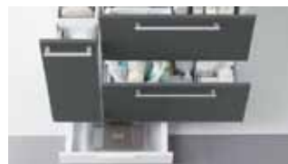
TOTOの配水管を工夫し引き出し収納量を増やした「奥ひろし」システム