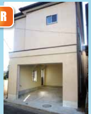
1階は車庫にリフォームしました。