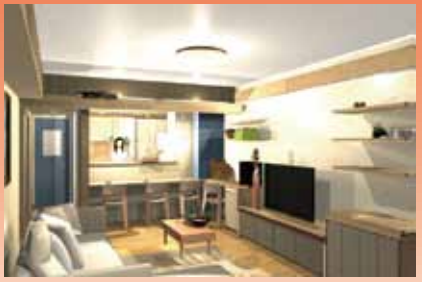
完成予想 3D 図

今回は、眺望の良い中古マンションを購入し、明るいナチュラルカントリー風にリノベーションされたお住まいのリビングをご紹介します。マンション特有の梁を利用した間接照明で多彩な表情を演出。床や柱は無垢の木材を壁は吸湿性のある素材やカラフルなクロスを使い、色を楽しむインテリアでまとめました。