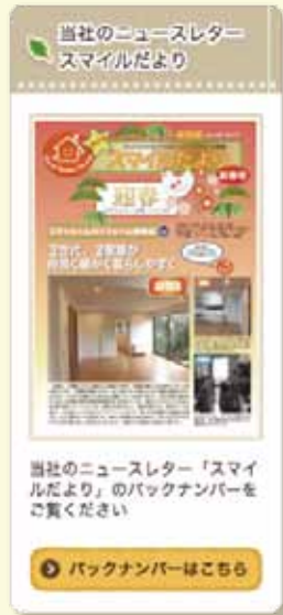
「スマイルだより」の誌面がネットでも読めます。

当社のホームページが生まれ変わりました! 今までよりもさらに見やすく、ためになるリフォーム情報も満載です。 ぜひ遊びにいらして下さい。