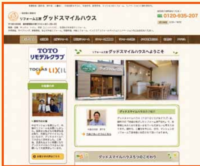
トップページはこちら