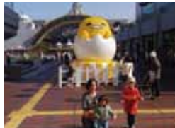
ピューロランドが見えてきました!