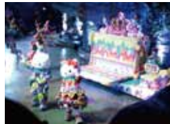
ミラクルギフトパレード