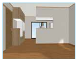
プラン2 (キッチンの部分だけ上部壁付き)